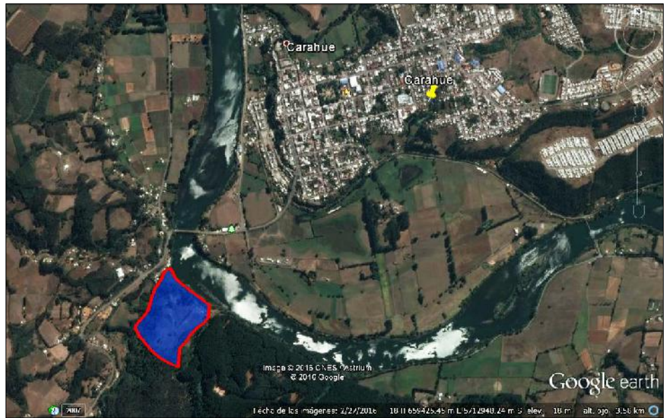
PLANO UBICACION LOTEO